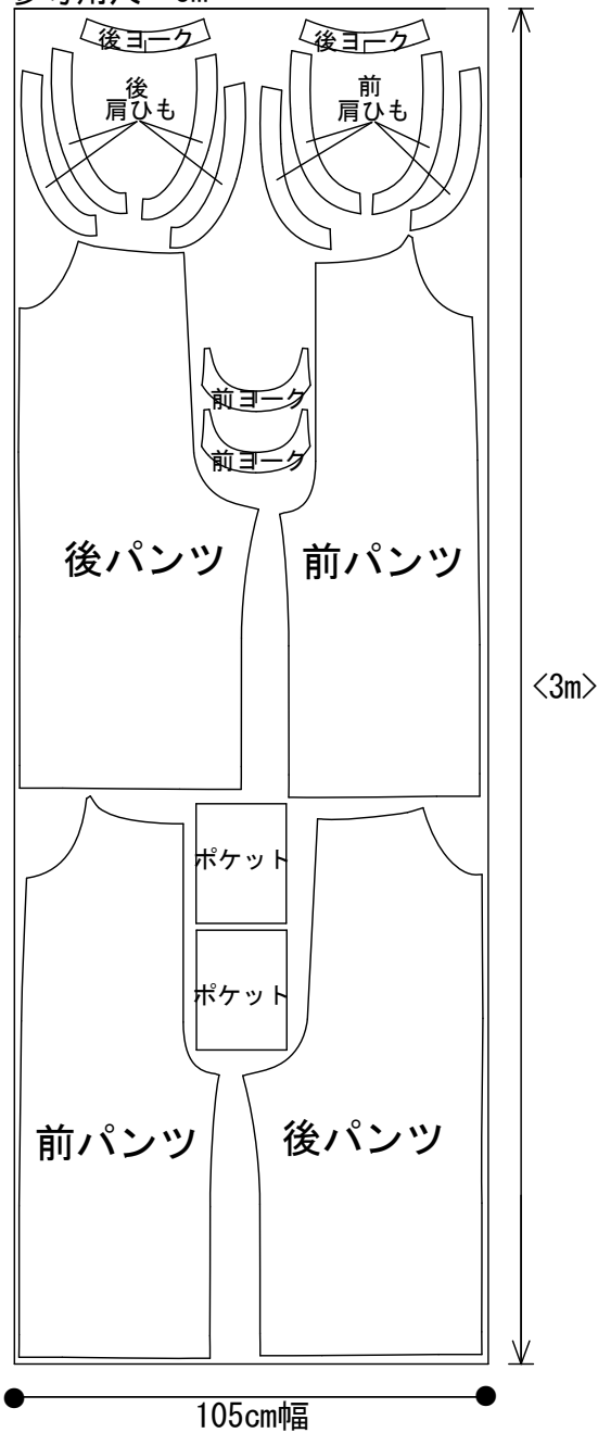
【40】 参考用尺 3m